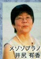
メゾソプラノ 井尻 有香