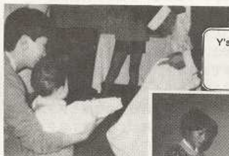
Y's Men International Skip a meal for Time of Fast