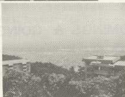
大パノラマ日が暮れると 一〇〇〇万ドルの夜景に