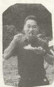
「肥満の月」とはプリテン君