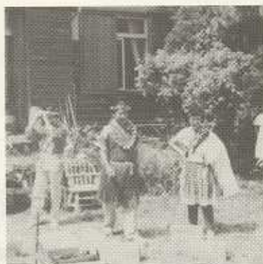
いでたち さすが 正司夫妻 はっぴ姿は山田会長