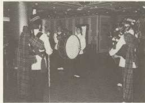
入場行進をリードする香港YMCA エース・リレーのパイプ音楽バンド