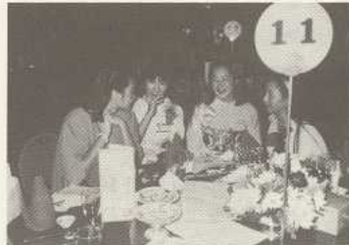
和気あいあいのわがコメント達。