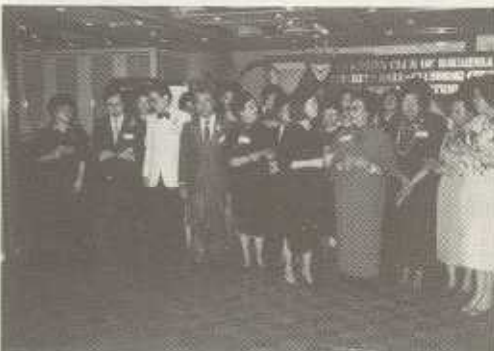
両クラブ全員で、ボヒニア・クラブの歌及び「四季の歌」を合唱するところ