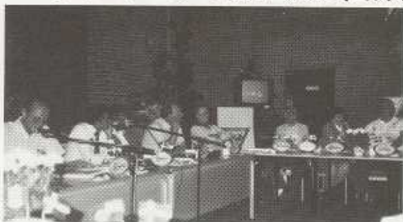
国際議会の会議風景 右より三人目は福田日本Y同盟委員長