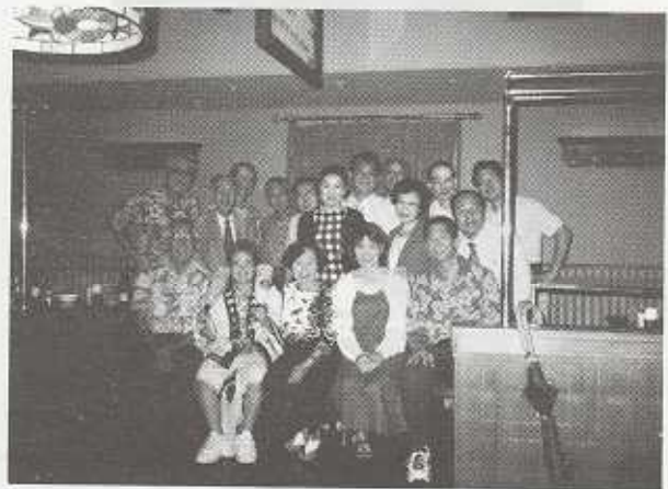
(8/8 大阪でのヒラナカファミリー歓迎夕食会)