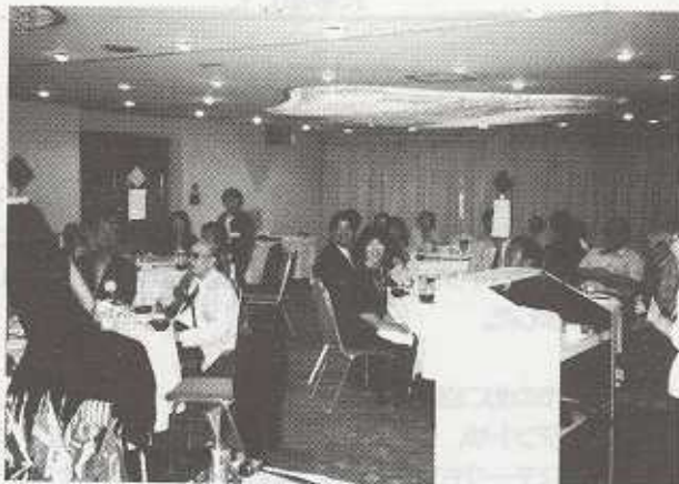
(懇親タイムは 会場一杯に笑いが・・・)