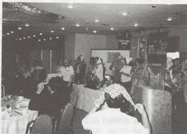
(なかのしま劇団・松下団長指導による“ハンケチ振れば〜”)