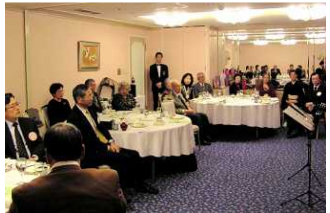
デュオ・アゲインの歌声に聞き入るメンバー