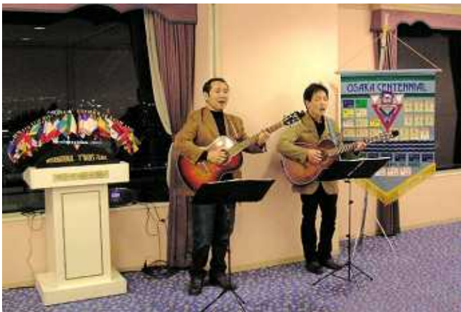
熱唱中のデュオ・アゲインのお二人