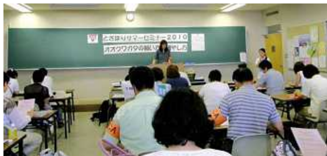
日本語学校のスタッフとボランティアとの事前打合せの様子

すっかり夏の風物詩となった街の学校「とさぼりセミナー」が、7月25日、大阪YMCA土佐堀会館で開催され、たくさん子どもたちでにぎわいました。