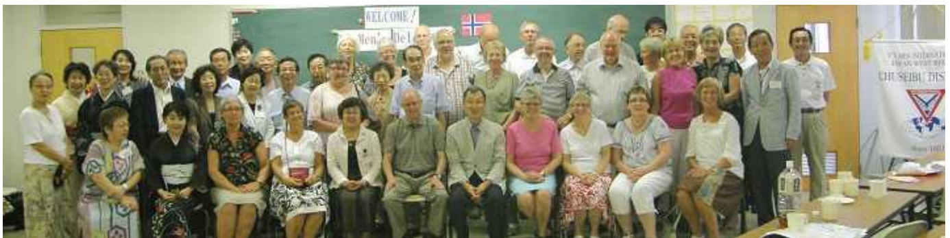
最後に記念写真「ハイ!チーズ!!」