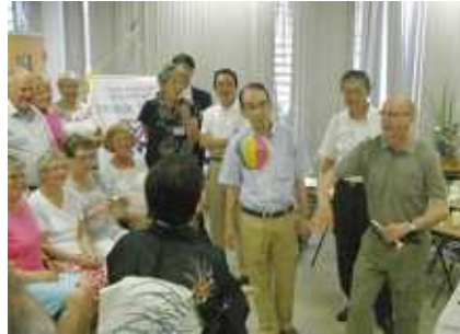
琴、紙風船、独楽、折り紙などで交流の時間を持ちました