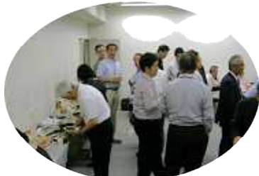
楽しい会話のひと時!