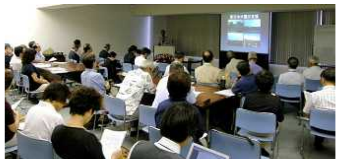
Y Y フォーラム会場