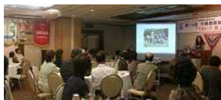
午前中に行われた合同メネット会

9月17日(土) ホテルクライトン新大阪で中西部会が行われ、140名余りの参加者があり盛大に行われました。