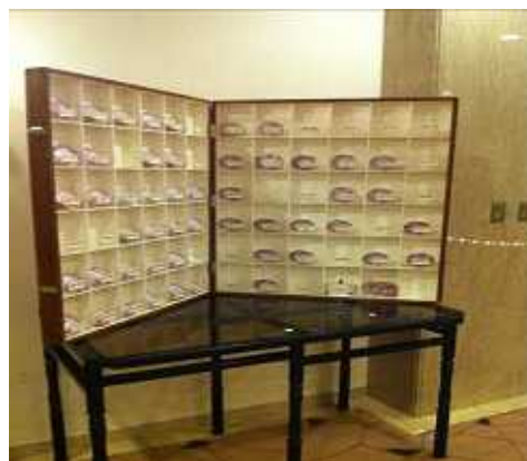
京都バレスクラブのこのバッジの数の多さはすごい!