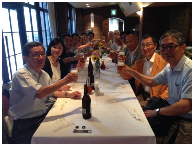
でも終わった後のビールは最高！(下)