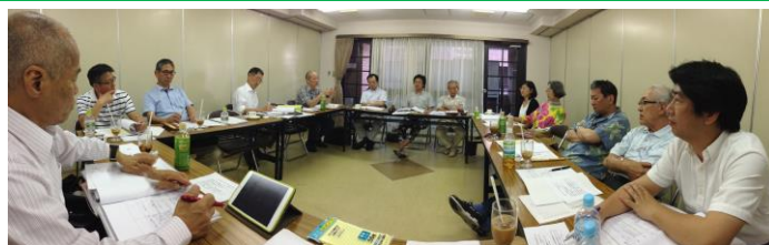
熱心に意見を出し合う面々。問題は山積み！(上)