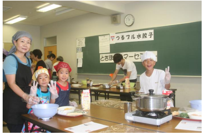
つるプル餃子作った！大満足の子どもの笑顔！