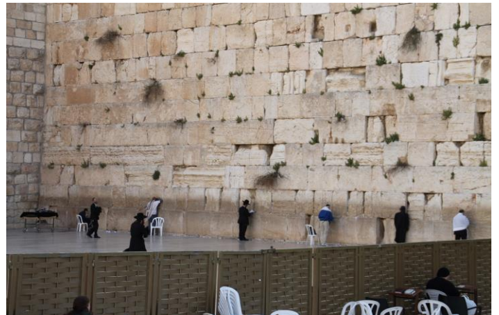
「嘆きの壁」の前にひざまずくユダヤ人たち（写真-2）