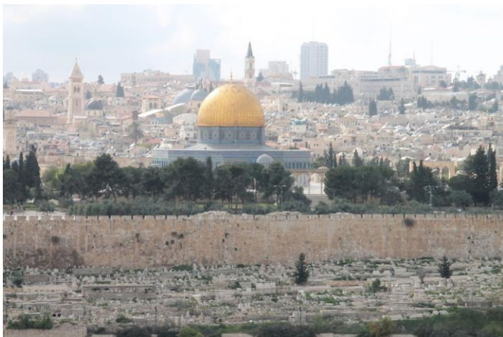
エルサレム旧市街は城壁に囲まれた街（写真-1）

今回の紛争に発展したガザ地区（Gaza Strip）ですが、パレスチナ人が大勢住むヨルダン川西岸地区とこのガザ地区（地図参照）は、イスラエルとパレスチナの両政府間で、1993年に歴史的な「オスロ合意」が成立。平和が実現しました。しかし、その後、ガザ地区はイスラム過激派ハマスが実効支配。イスラエルに対してミサイル攻撃を仕掛けるにおよび、停戦協定が破られ、再度紛争が激化しました。ガザ地区の住民の死傷者が増加。速やかに停戦が実現し、再び平和が訪れることを祈ります。