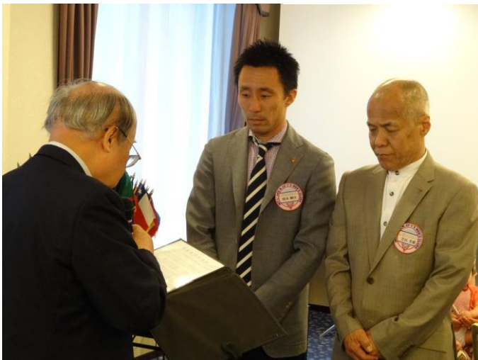
清水中西部長の司式で新旧会長の交代式で見せる岡本メンと芝田メンの神妙な顔つき