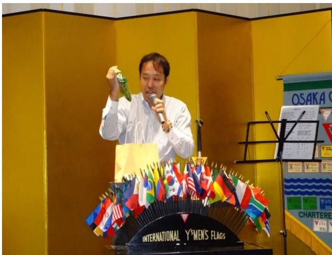
野菜のクイズに正解すると、この枝豆がもらえる!

続いて、わがウクレレバンドとフラチーム=写真=の出番で、例会も最高潮達し、「カヒマナヒラ」など全4曲を、華やかなフラと、かるやかなウクレレの音でハワイアンナイトの夜を彩りました。 (中村茂高)