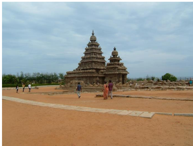
南インド・チェンナイの海岸寺院=写真/三浦直之