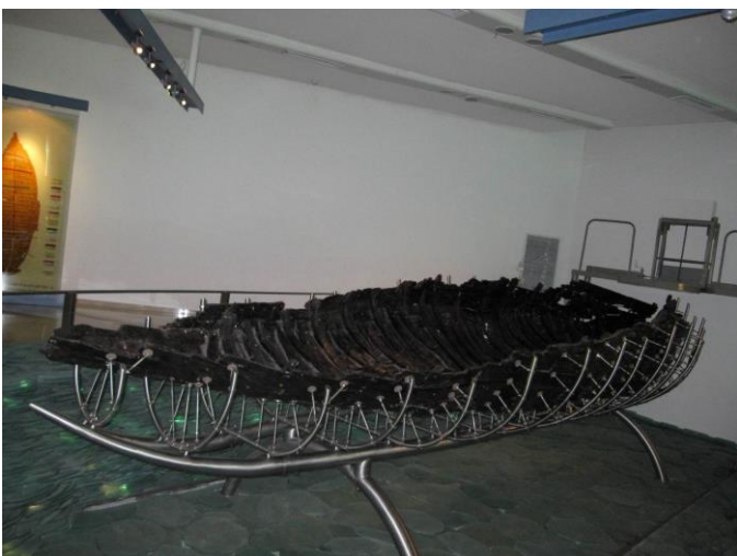
イエスの時代の船