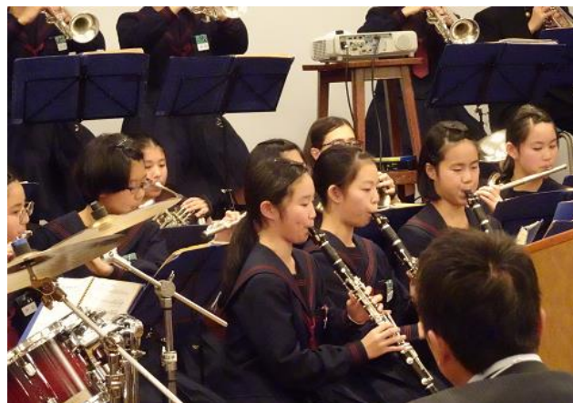
すばらしい演奏を披露してくれた堀江中学校吹奏楽