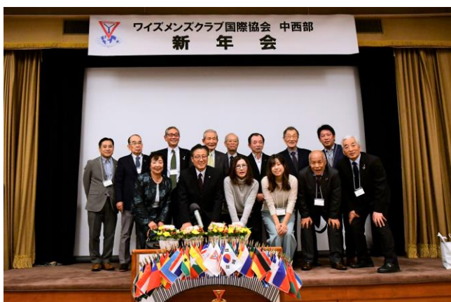
終了後、舞台上がって、ハイ、チーズ！