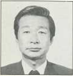
岡 本 公 一 〔ブリテン〕 Okamoto Kooichi