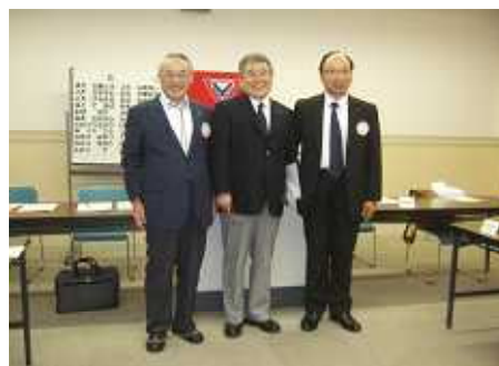
於：7月例会での会長交代式