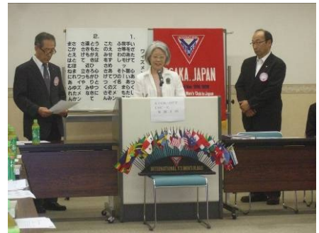
於：7月例会での会長交代式

ところ：大阪土佐堀YMCA 6階 601室(変更になることがありますので、ご注意ください。)