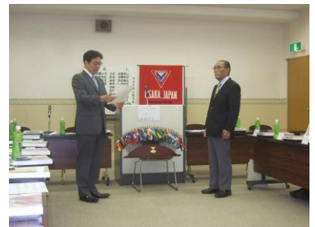
於：7月例会での会長交代式