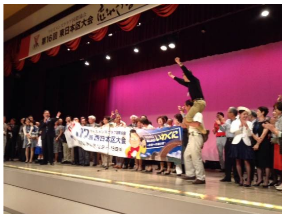
東日本区大会で西日本の参加者による次期大会アピール

6/8～6/9 東日本区大会に13名が参加して来ました。被災地現場で奮闘される戸羽陸前高田市長の特別講演は、「現在の苦悩と全てを失った町が世界の模範都市へ再生する夢を語られたお話」参加者全員が感銘を受けました。