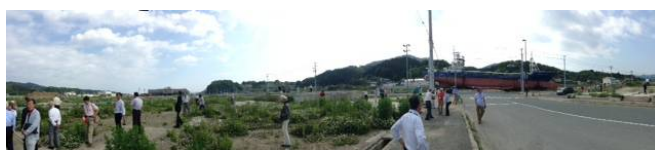
海から、結構な距離に取り残された船