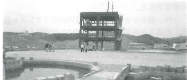
【写真説明】 上：放射能を示す道路標示版 下：鉄骨むき出しの防災対策庁舎(南三陸町)