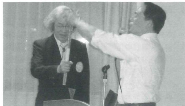
[写真説明] 上：中西部被災地訪問団 中：5月例会講師とビデオ 下：5月例会研修風景