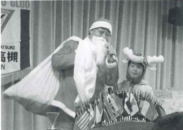
会長サンタとマゴメットのトナカイ

年末恒例の今年の漢字が発表されましたが、今年は「安」という字でしたね。では高槻クラブの12月を漢字一文字で表すとどうなるのでしょうか。私は「楽」の字がいいのではと思います。