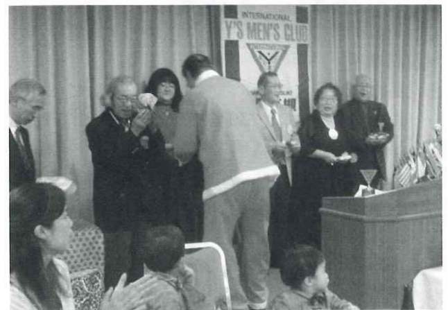
(上)ゲームで楽しむ (下)誕生日・結婚祝