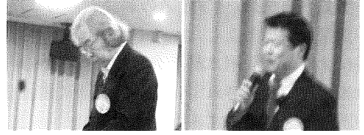
【写真】食前感謝の大谷メン・司会：河戸メン

若葉が色増す好季節にクラブ5月例会が西武高槻多目的ホールで行われました。出席14名。和気あいの楽しい例会となりました。