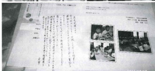
【写真】(上)どっこいしょ荷降し (中)市社会福祉協議会へ寄付 (下)各施設から礼状が続々と…