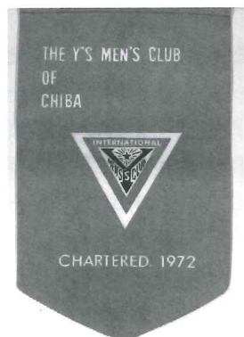
千葉クラブミニバナー