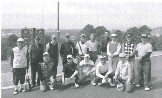
【写真】好スコアでご機嫌な面々

ゴルフを通じ、お互いに楽しく会話し、交流を深めることができました。お世話いただいた茨木クラブの皆様にご心より御礼申し上げます。