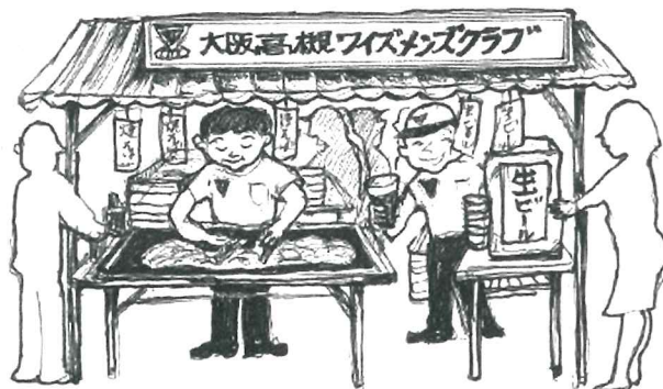
(イラスト：萩原メン作)