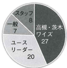
たかつき・いばらき Yボランティア

P.S.たかつき・いばらきYMCAのFacebookに是非ワイズメンズクラブの活動情報を掲載してください。積極的に地域のYボランティアグループ活動紹介・宣伝していただきたいと思ひます。