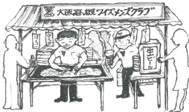
(イラスト：萩原メン作)