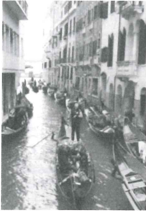
▲街の中の水路を多くのゴンドラが往来。 ▶サンタ・マリア・デル・フィオーレ大聖堂をバックに記念撮影。

また、浸水被害が収まった後には日本でも猛威を振るっている新型コロナウイルスが蔓延し、多くの感染者と死亡者が出ています。旅行があと10日遅かったら無事に帰国できなかったのでは、と胸を撫で下ろしています。