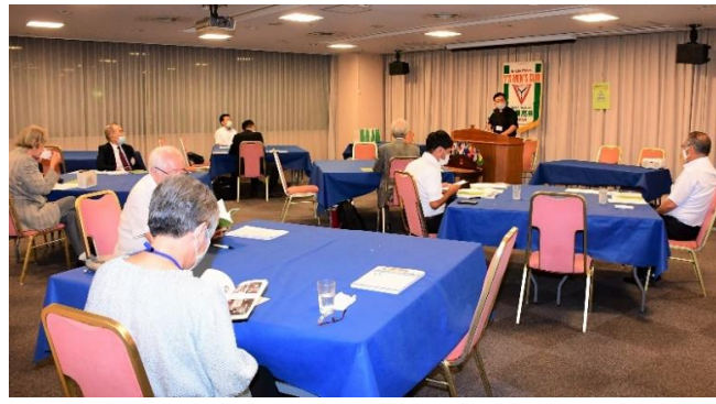
↑三密を避けて着席した例会場

当初は3月に来ていただく予定でしたが、例会が中止となったため5月に延期し、さらに5月例会も中止となり、やっと今月に実現しました。「牧師のお仕事あれこれ」と題するお話では、日曜日以外の牧師の仕事について教えていただきました。牧師の仕事の中心は「説教と牧会」と話され、日曜日以外の日は牧会活動と説教の準備に多くの時間が割かれていることが分か