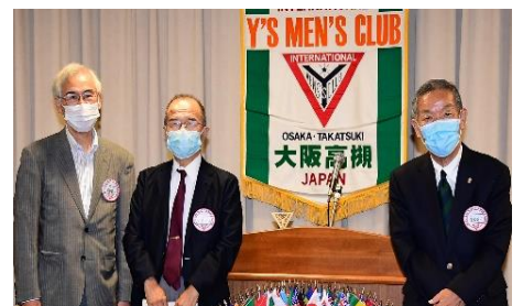
↑誕生日のお祝い贈呈

こうした中で、できる限り例年通りにやりたいと思っています。また、こんな状況であればこそワイズとしてできることを模索したいと思っています。