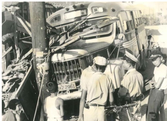
初めて新聞に掲載されたバス事故の写真

その時は自宅からカメラを持ち出し、記念撮影するような感覚で撮影しました。現場検証が済むとすぐにクレーン車が来てバスは撤去されました。自宅に帰って夏休みの宿題をしていると新聞社の記者が来られ、「バス事故の写真を撮られたと聞いた。提供してください。」とのこと。