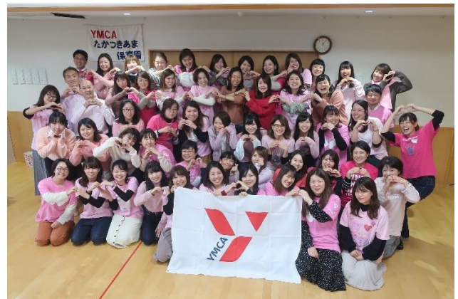
昨年のピンクシャツデーに集まった保育園の保護者、職員が記念写真を撮りました