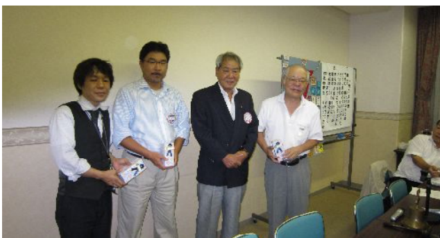
誕生日・結婚記念日のお祝い

合同事業委員会では、活動方針の具体的活動としての例会等が話し合われました。以上。