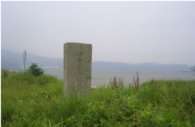
貯水池の畔に建つ日本人記念碑

韓国の光州からバスで一時間半ほど南の長興という町でバスを乗り換え、さらに一時間ほど南へ行った、大徳邑という農村のはずれの貯水池のほとりに、草に埋もれて一基の石碑が建っています。2008年7月、卒業論文の資料収集をするため、五日間ほど当地方に留まり、農業振興に関する諸機関を訪ねたものの、思うような資料を見つけられず、やむを得ず、ソウルへ戻るつもりで席を立とうとした時、担当の職員の口から、思いがけない言葉が出ました。自分が担当している地域に見慣れない石碑が昔からあり、全面に漢字が彫られているが、何の碑かわからず、誰も知らない。もしかして、何かの役に立つかも知れないから参考までに、とのことであつた。滞在を一日延ばし、その職員の書いた略図を頼りに、翌朝、貯水池へ足を運びました。日の照りつける暑い朝でしたが、もう数人の人が池の畔に腰をおろして釣り糸を垂れています。