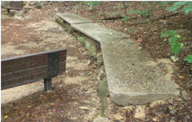
巨木の下に並ぶ石のベンチ

今回はソウル南山の「石」の話です。南山は韓流ドラマや映画の舞台としても有名で、車体の横に「撮影地ツアー」と日本語で大きく書かれた観光バスが韓流ファンの外国人観光客を南山の撮影地スポットへ運んでいます。ソウルタワーのあたりは、さしずめそのメッカと言えるかも知れません。観光客で賑わう場所を離れると、南山中腹に設けられた遊歩道をソウル市民の人達がウォーキングをしている姿をよく見かけます。近代韓国の苦難の歴史はここ南山から始まったと言っても過言ではないでしょう。南山山麓には韓国統監府や初期の朝鮮総督府が置かれ、さらに高台には朝鮮神宮や京城神社・乃木神社などが造営され、それまでとは全く異なる趣となりました。それらが終戦と共に撤去された今は、それらの姿を目にすることは出来ませんが、じっくり歩いてみると、所々に痕跡を見ることが出来ます。統監府官邸跡の林の中には石のベンチが数基置かれています。