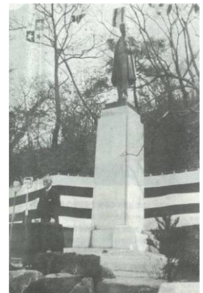
除幕式の写真

近づいてよく見ると、そのうちのひとつの板状の石材の上面に《男爵林権助君像》と彫られた文字が明確に残っています。この花崗岩石材は銅像の台座の側面に使われたもので長さは縦 274cm、横 85cm です。ここにある石のベンチは全て銅像台座の石材が利用されています。林権助は日露戦争を前後した時期に 8 年近く駐韓日本公使の任にあり、その後の日韓併合への足がかりを作ったと言われています。1936 年に喜寿を迎え、これを記念するために銅像が建立された場所が旧朝鮮総督官邸構内であったこと、また、撰文が徳富蘇峰であったことから、当銅像の建立がどんな意味を持っていたのか想像に難くありません。昭和 11 年 12 月 2 日の毎日申報は、総督府はじめ各界の面々が列席して行なわれた除幕式の様子を伝えています。韓国で厳しい評価を受ける林権助ですが、銅像台座の残骸が残存していることは、戦後、長い間、この地域一帯が韓国の特殊機関の管理下にあったことが影響しているのかも知れません。