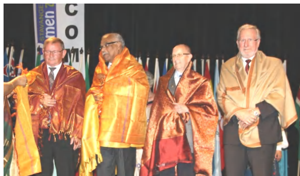
左からポール・トムセン次期国際会長、フィリップ・マタイ国際会長、フィン・ペデルセン直前国際会長、エリック・ブロウム国際会計