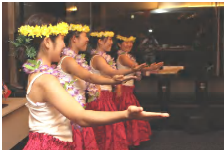
関学フラサークル マハロのみなさん

「マハロ」とはハワイ語で、ありがとうという意味と聞きました。初めて司会をつとめさせて頂きましたが、40名以上のゲスト・ビジターが御出席され、大いに盛り上がりとおもいます。多大なるサポートと励ましと多くのゲスト・ビジターの皆様のおかげです。まさに「マハロ」な例会でありました。