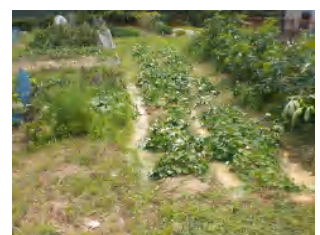
正午 除草作業終了