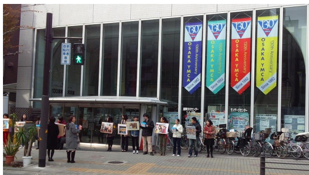
土佐堀会館前で「おねがいしまあ〜す！」