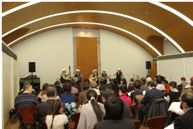
約130人が来場し、約12万円の収益がありました。