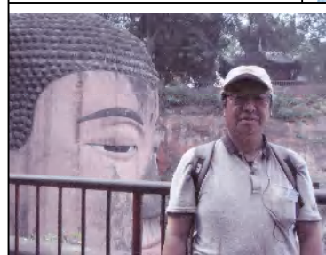
中国：樂山大仏頭部