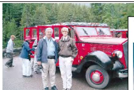
アメリカ：グレイシャー公園の 園内ツアークラシックバス

万里の長城も数々有り、司馬台長城は明代からあまり修復されず、少し崩れかけた長城を歩くのもスリルがありました。他にも感動するものは数限りなくありますが、特にカンボジアのアンコール寺院群、中国敦煌の莫高窟の塑像群は印象深い遺跡です。