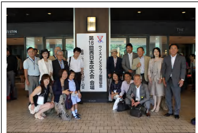
大阪土佐堀クラブ、総勢16名で参加!