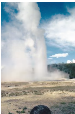
アメリカ：イエロース トン公園の大間欠泉