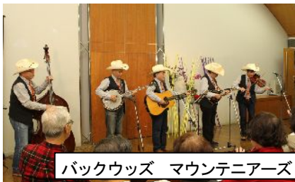
バックウッズ マウンテニアーズ