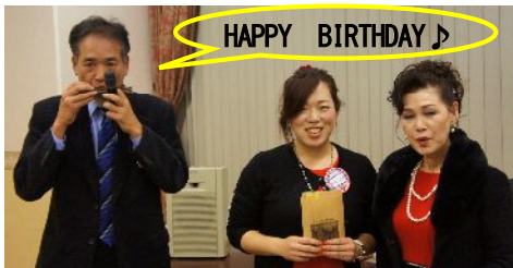
大阪YMCA会館1階のクリスマスツリー

各々この1年に始めたものの事、感動したこと、入会秘話、そしてワイズを通して感じていることを、ほんと皆さんお話し上手で、楽しく聞かせてもらいました。