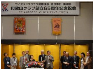
中西部からの参加者集合

長くクラブを支えて来られたメンバーへの感謝の表彰や、65年を一気に振り返る時間もあり、これからまた新たに歩みを進めていこうという気概が感じられました。