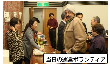
当日の運営ボランティア