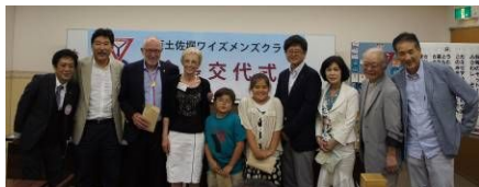
誕生日・結婚記念月 のみなさんのお祝い