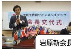
岩原新会長 就任挨拶