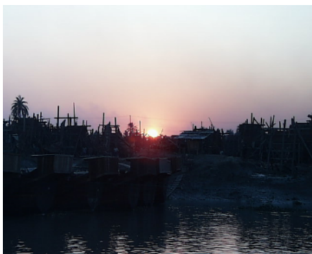
20世紀最後の太陽が沈む瞬間の夕日

確かに当時はサイクロン災害が話題となり、シェルターの建設などで支援金が集まりやすい状況が生まれていたとはいえ、自力で何とかしなければならぬとしか考えていなかった私には大きな驚きでした。こういう自立の仕方もあるのか・・・と。これは世界同盟がリソースモビリゼーションを推奨する背景につながっているのではないかと私は考えています。