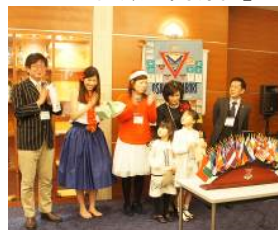
誕生日&amp;結婚記念日