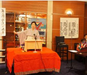
旭堂南照氏講談 「忠臣蔵大高源吾」