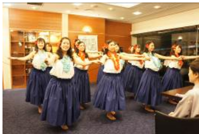
マハロのパウスカートお披露目フラ