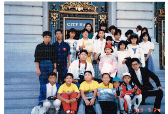
サンフランシスコキャンプツアー 市庁舎前で

私がYMCAに奉職したのは、大学卒業直後の1982年4月です。外資系の製薬会社から内定はもらっていたのですが、いわゆる社会の1歯車になることに抵抗を感じるモラトリアム人間だった私にはどうにもすつきりませんでした。そんな時ふと予備校生として1年間通った土佐堀YMCAのことを思い出しました。「YMCAで英語を教えられたら・・・」土佐堀で英語講師試験を受け、何とか合格させて頂いたのが、私の職場としてのYMCAの始まりでした。2年間は非常勤として土佐堀、天王寺、茨城地域センター（当時の高槻Y所管）をそれぞれ週2回、主に小・中学生に英語を教える機会を与えられました。予備校生の頃慣れ親しんだ土佐堀会館は建て替えの最中でなにもわ筋の西側にあった仮校舎で授業をしていたことを思い出します。天王寺ももちろんとても狭い旧会館でした。3か所のYCMAsを巡り多くの先輩教職員の皆さんにご指導頂いたのは大変幸運なことでした。84年には現在の第3代土佐堀会館が完成し、私はラッキーにも真新しい会館で大阪YMCA語学・体育専門学校（現在の国際専門学校の旧名称）で専任講師として奉職させて頂くことが出来ました。若手の教員として昼間は英語学科・秘書課・国際ビジネス学科・社会体育学科、夜は中学・高校生とエネルギーな若者たちと丁々発止とやっていたのが昨日のことに思い出されます。87年には小・中学生21人を2週間のサンフランシスコキャンプツアーに引率し、無我夢中で生徒のケアに追われ、帰国途上から肺炎になったこともありました。その頃から部分的に開設間際のIHSに関わり（IHSは88年開講）、91年4月から21年間IHSのディレクターとして専従させて頂きました。