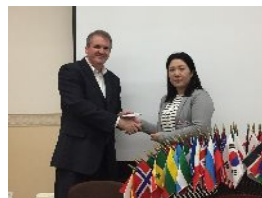
貴重なお話ありがとうございました！