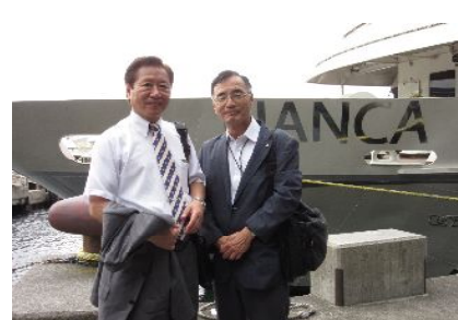
琵琶湖汽船・ピアンカを貸切でとても豪華！