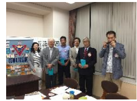
毎月のお誕生日は福島メンのハーモニカでお祝い♪