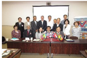
2か月ぶりのYMCA会館での例会でした