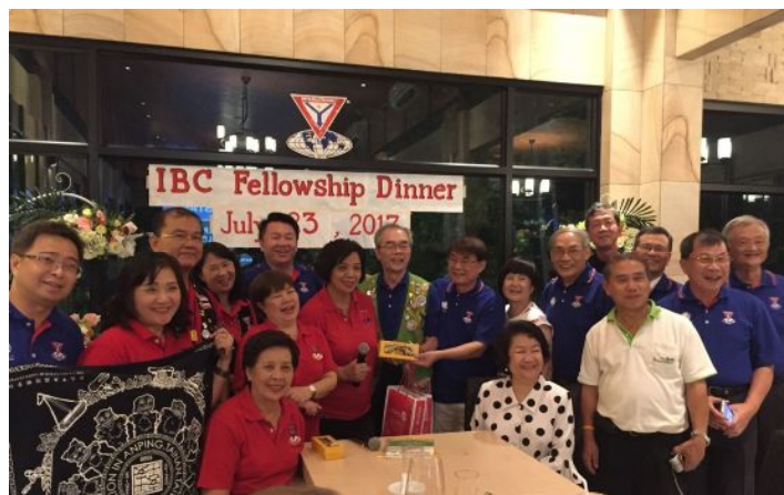
写真①チェンマイクラブと台北セントラルクラブのメンバー

② タイからシンガポールに移動したあと7月30日シンガポールベータクラブの例会にご招待いただきました。会場はシンガポールオーチャードYMCAで、最近改装され大変きれいな会場で食事をいただいたあと、例会で話をさせていただきました。ベータクラブはオーチャードYMCAを支援しておられ、施設の改修などによりYMCAがより活気に満ちている印象でした。