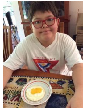
ある日双子の目玉焼きが!

そう言われても、3歳の双子には、エルビンがなんで怒っているのかわかりません。でも、次の日から、2人は呼び方を変えたのです。「アンティカズン」(いとこおばちゃん)と。