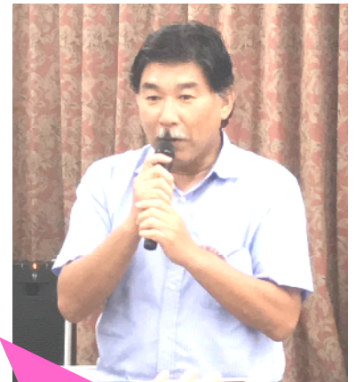
交流事業 (岡野/岩田)