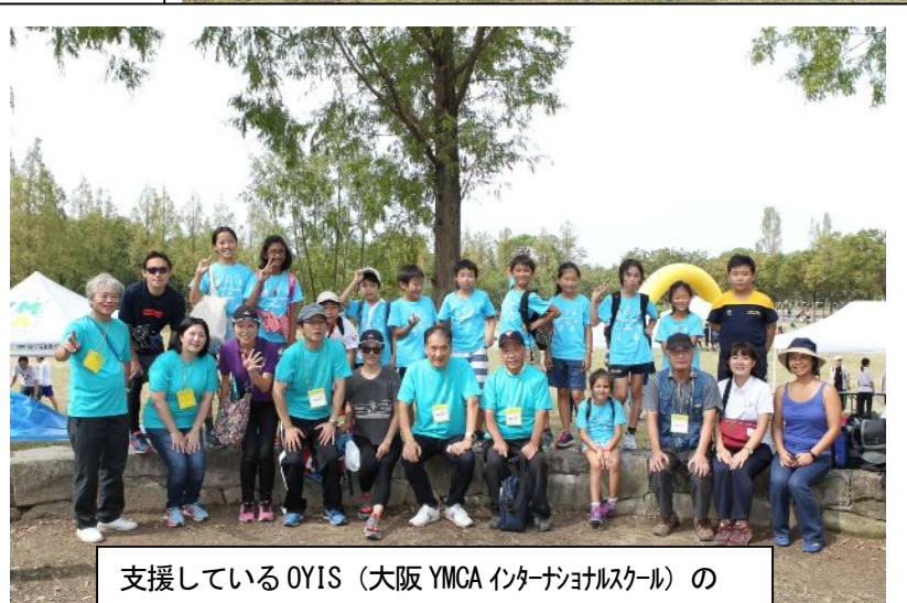
支援しているOYIS（大阪YMCAインターナショナルスクール）のランナーとご家族のみなさんと一緒に記念写真！