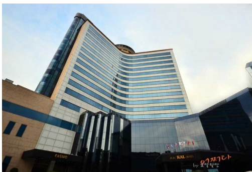
コンサートが開かれた濟州 KAL ホテル