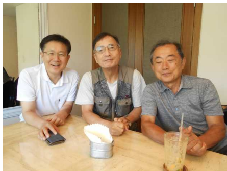
三多クラブが市内に昼食を準備してくれました。手前、右端が会長。濟州らしい、魚主体の献立でした。