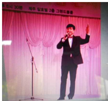
三多クラブ会長が出席者へ歓迎の辞を