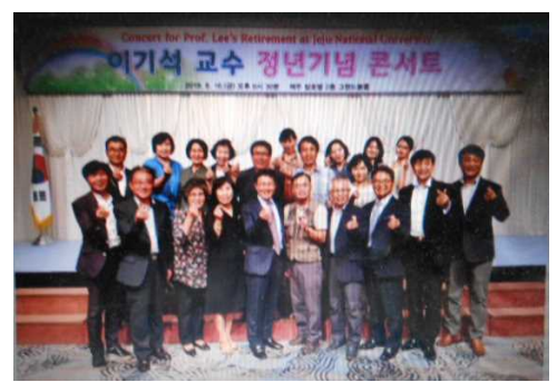
三多クラブメンバー並びにメネットと共に