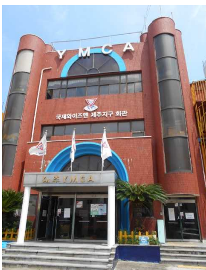
ワイズメンズクラブ濟州地区の事務所があるYMCA会館。中程に「ワイズの濟州地区」の標示が見られます。