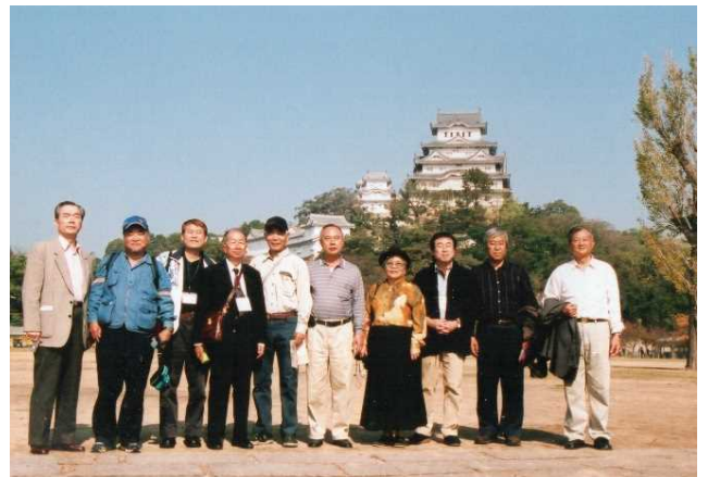
台北セントラルクラブの皆さん 2004. 11

親愛なる台北セントラルクラブが創立40周年を迎えられたことを土佐堀クラブのメンバーの一人としてお祝い申し上げたいと思います。