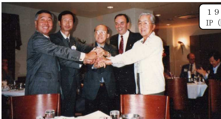
台北セントラルクラブの40周年記念に寄せて

そもそもIBCトライアングルは1978 / 79年のニッセン国際会長の提案で先進国にある2つのクラブが発展途上国にあるクラブ一つを助けようというものです。当時、土佐堀とベストラスとケニアのヌゲワクラブのトライアングルはそんな意図を酌んで日本最初のIBCトライアングルとなりました。大分昔ですが、地元の人達も見るヌゲワクラブ所有のテレビが盗難に遭った時、土佐堀とベストラスで新しいテレビを買う資金を送ったことを覚えています。（参考：土佐堀ブリテン、35周年記念誌ほか）