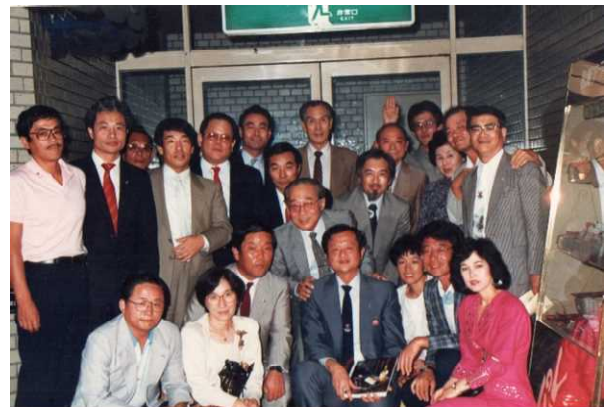
↑ 台北セントラルクラブ 他 交歓会 ↓

今回は新型コロナウイルス流行で残念ながら訪問ができませんが、IBCトライアングルなどで土佐堀クラブと共通のIBCを持ち、活発な国際交流活動を展開する台北セントラルクラブに敬意を表すると共に、輝かしい節目の年を迎え、ますます、ワイズダムで素晴らしい働きをされることを心から願います。