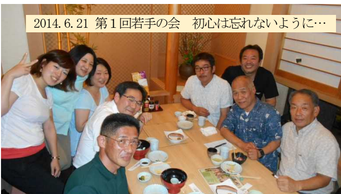
2014.6.21 第1回若手の会 初心は忘れないように...